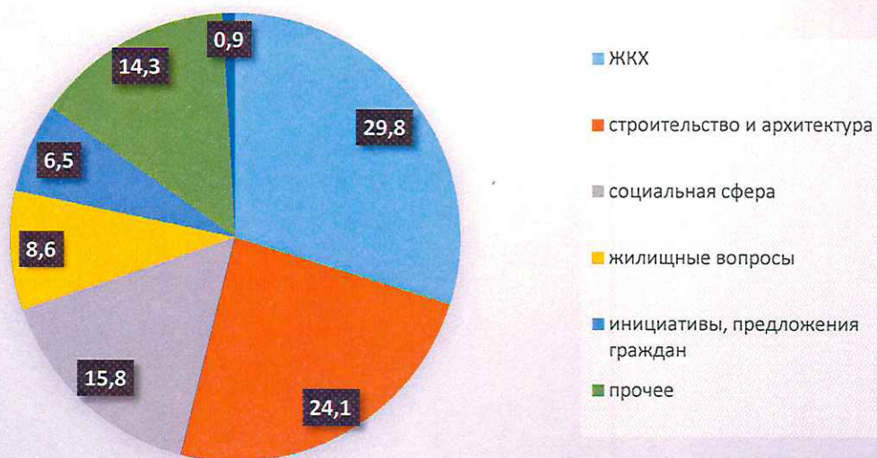
Диаграмма основных тем обращений граждан в 2016 году по разделам (общее количество обращений 253)